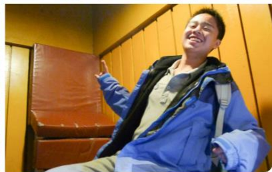
學弟學妹平平安安、身體健康