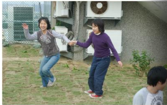
我想起童年的有一天 我看見你全心全意的旋轉 一夏宇